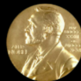
President Martti Ahtisaari was awarded the Nobel Peace Prize in 2008.

"I promised my support to the institute, if it is a part of normal activities and provides added value to the planned projects. I am glad that the University of Oulu is proceeding in economic and business sciences." (President Ahtisaari in the grand opening ceremony of the institute in 2008)