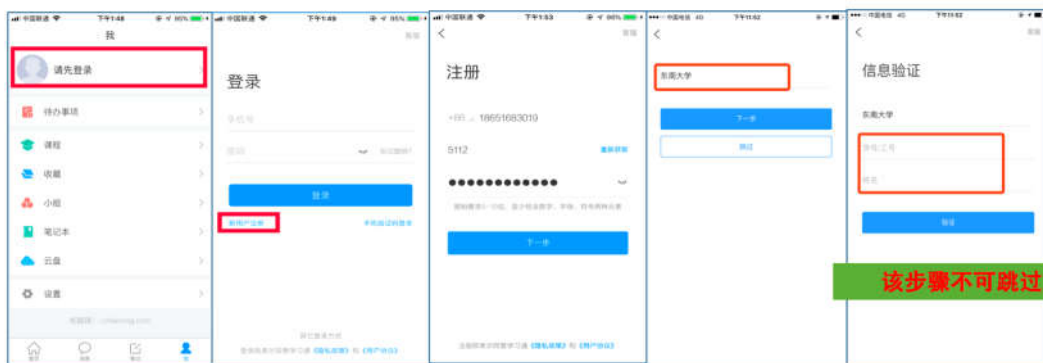
注册—信息验证流程

登录成功之后，点击个人头像处进行单位和学号确认，若无单位显示，则为未绑定成功，需再次进行单位和学号的绑定操作。