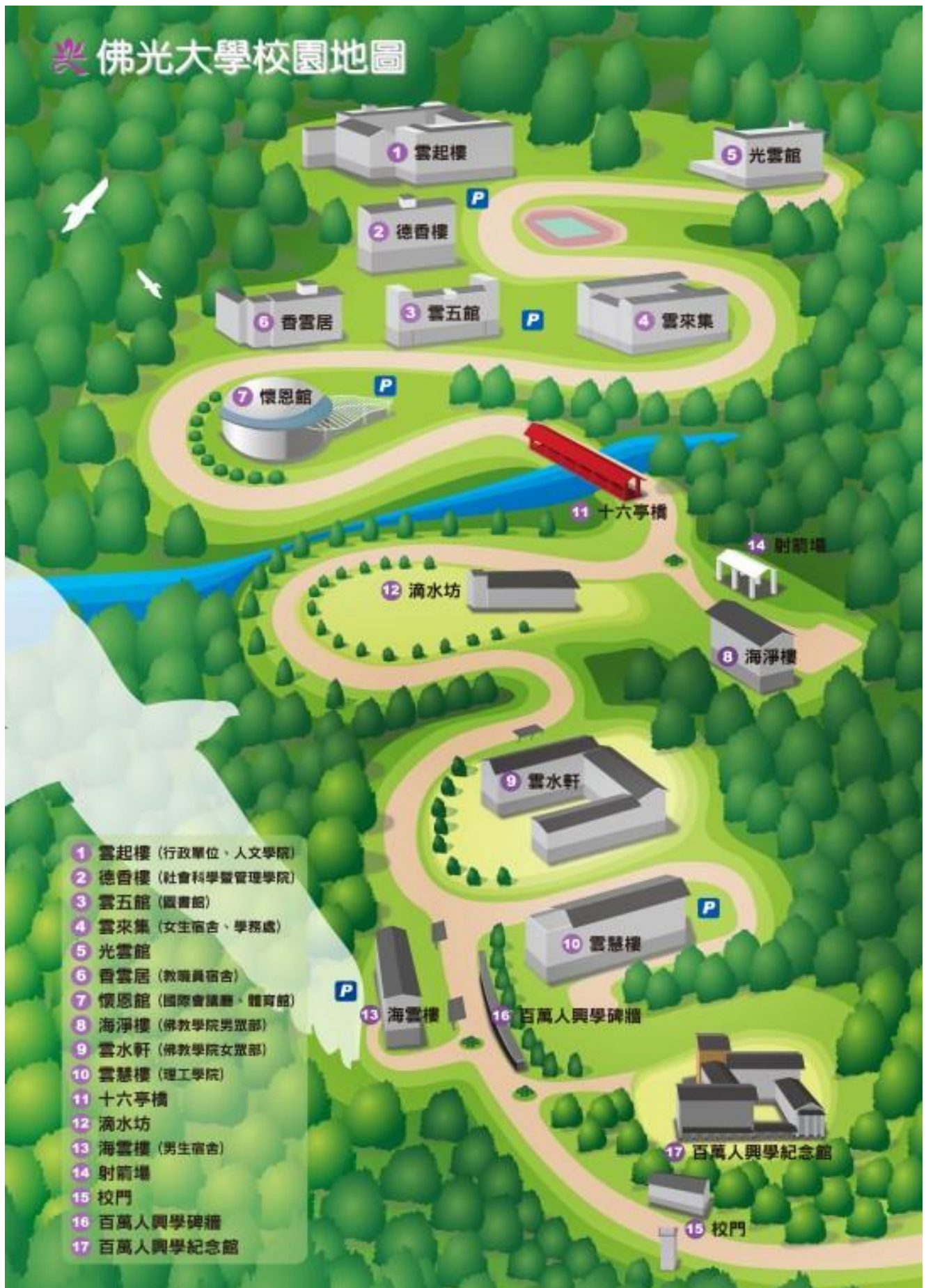
佛光大學校園地圖