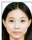
頭部比例 過大或頭 髮碰觸到 照片邊框