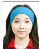
臉部及雙 耳被物品 遮蔽