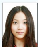
頭髮遮蔽 到眼睛或 耳朵