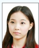
頭部側向 一邊、未 正視鏡頭